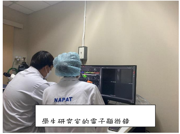
學生研究室的電子顯微鏡