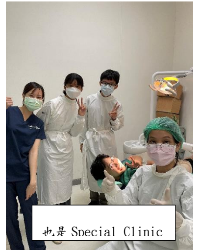
也是 Special Clinic