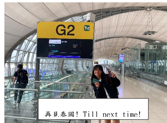
再見泰國! Till next time!