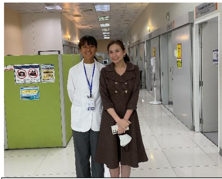
與 Oral Radiographv Clinic 教授