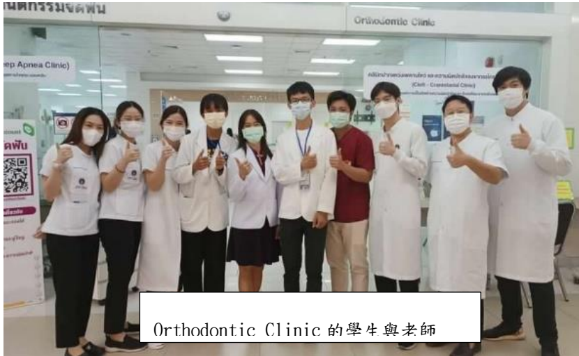
Orthodontic Clinic 的學生與老師