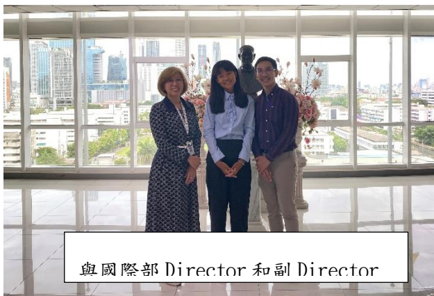
與國際部 Director 和副 Director