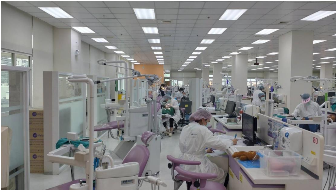
Main Clinic：配置九十個診療椅的空間

一個月的時間也能感受到當地的學習環境是怎麼產生的：政府的財力支援、驚人的學費、有耐心的病人、便宜的學生門診、幾乎沒有寒暑假等等，太多因素構成這個環境。我們永遠都在而且好像也只能在追求理想的道路上，想複製環境不可能完全只複製優點，那就在看見別人優點的同時，揀一點合用的來試試看，首先優化自己的技能以及病人在診療椅上的體驗。